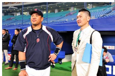
プロ野球/元中日ドラゴンズ 山崎武司氏(現解説者)

2013年はテレビ朝日の情報番組『グッド! モーニング』スポーツコーナー担当。2015年9月、三条市下田に移住。現在はNPO法人ソーシャルファームさんじょうに所属して、下田地域でスポーツを通じた地域活性に取り組む。