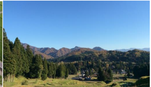
下田の風景/旧荒沢小付近