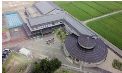
NPOの活動拠点/旧荒沢小学校