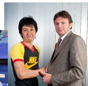
サッカー/元日本代表監督 フィリップトルシェ氏