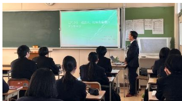
11.27 三条商業高「出前授業」