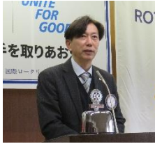
会長挨拶 三条南ロータリークラブ 会 長