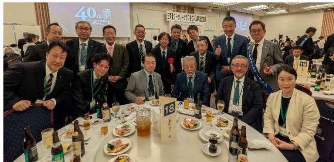
4月18日 三条北RC 創立40周年記念式典祝賀会 (於:ジオワールドVIP)