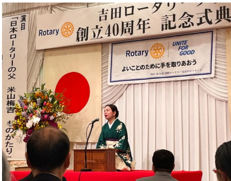
4月11日 吉田RC 創立40周年記念式典 祝賀会(於:燕三条ワシントンホテル)