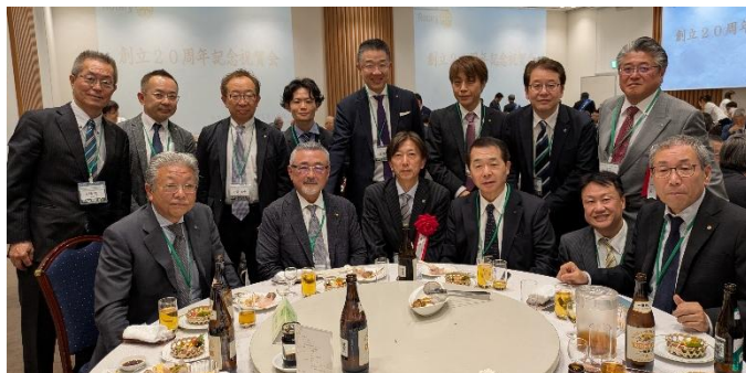
5月9日 三条東RC 創立20周年記念式典祝賀会 (於:ジオワールドVIP)