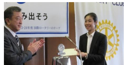
ナンさんへ7月分の奨学金をお渡ししました