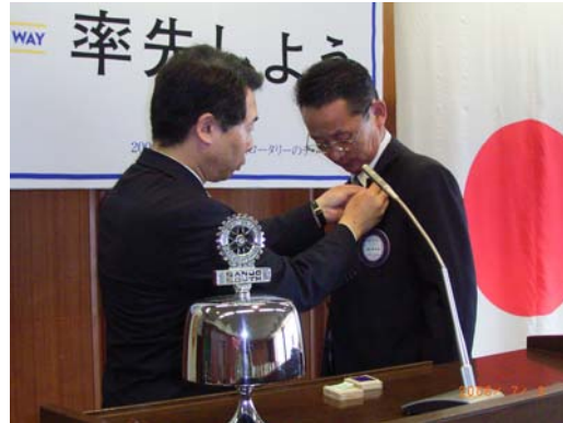
会長、幹事バッチ交換