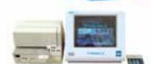
電子式トラックスケール