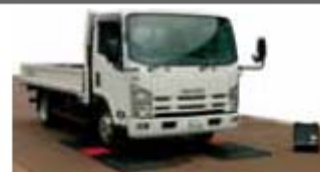
走行計量式簡易トラックスケール