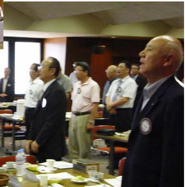
会長・幹事 バッチ交換