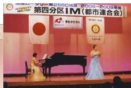
聴衆を魅了させたコンサート