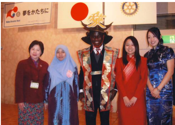
米山奨学生と詹学友会会長

3月7日(土)2008学年度、米山奨学生の修了式・歓送会が開催されました。奨学生の卒業式ともいえます。当日は、終了者14名と各大学からの指導教官4名を含め、カウンセラー、ロータリアン等合わせて62名のご出席を頂きました。終了奨学生の中には自国の民族衣装を身に纏っている人もいて、華やかであたたかい雰囲気の中となりました。今年の終了者は、奨学期間1年が9名、2年が6名の合計15名でした。